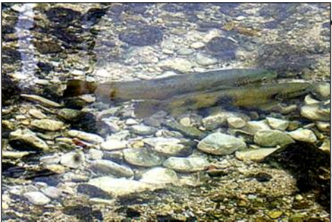
Fraysère de l'Albarine... ... La survie d'une espèce