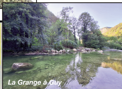
La Grange à Guy

L'Ombre commun une espèce menacée sur l'Albarine en grande partie dû à la prédation des oiseaux piscivores.